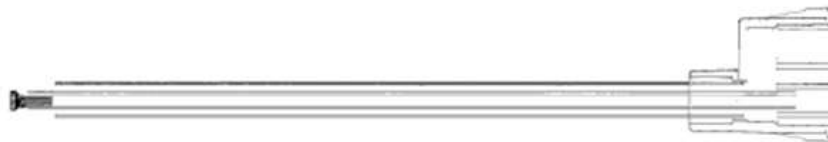
Im Set enthalten Koaxialaufsatz