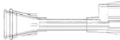
Im Set enthalten 30mm Trichteraufsatz